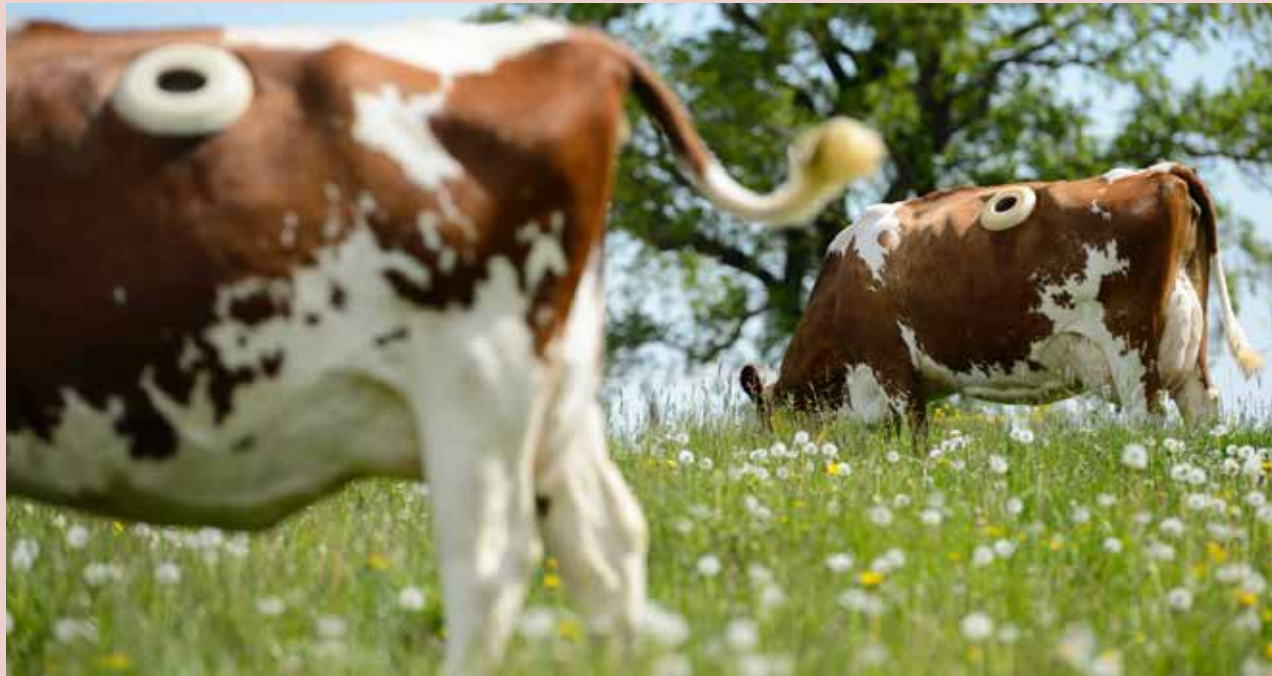
Met behulp van een opening (fistel) kan de pensinhoud van een koe worden onderzocht