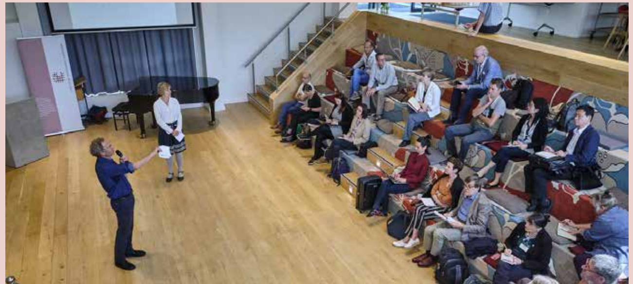
Levendige discussie over CRISPR-cas bij dieren tijdens CRISPRcon in Wageningen

In juni 2019 organiseerde de RDA samen met de Commissie Genetische Modificatie (COGEM) een discussiebijeenkomst over gene-editing bij dieren tijdens de internationale conferentie 'CRISPR-con 2019' in Wageningen. Het doel was om maatschappelijke opinies over dit onderwerp te peilen. Er ontstond een levendige discussie, waarin enerzijds de kansen voor het dier werden benadrukt. Anderzijds bleek dat er veel zorgen bestaan over de noodzaak van gene-editing-toepassingen en het daadwerkelijke voordeel voor het dier. Is CRISPR een oplossing voor problemen die wij in Nederland kennen in de omgang met dieren of is het een toepassing op zoek naar een probleem, zo werd de twijfel onder woorden gebracht. Deze discussie werd in 2019 ook binnen de Raad gevoerd. De Raad constateerde een behoefte aan een duidelijker beeld hoe we in Nederland zorgvuldig en verstandig kunnen omgaan met de