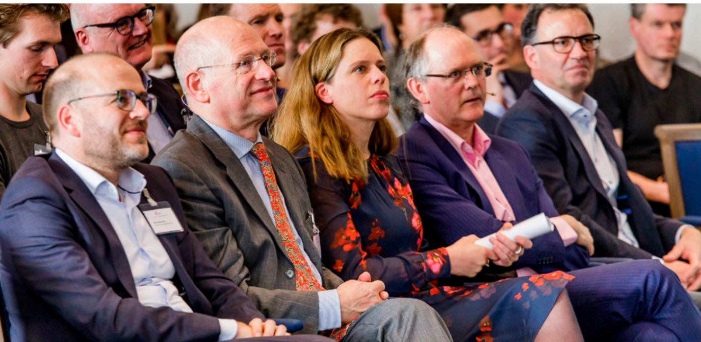
De minister van LNV, geflankeerd door de RDA-voorzitter en secretaris en het presentatieduo van het onderzoek De staat van het dier.