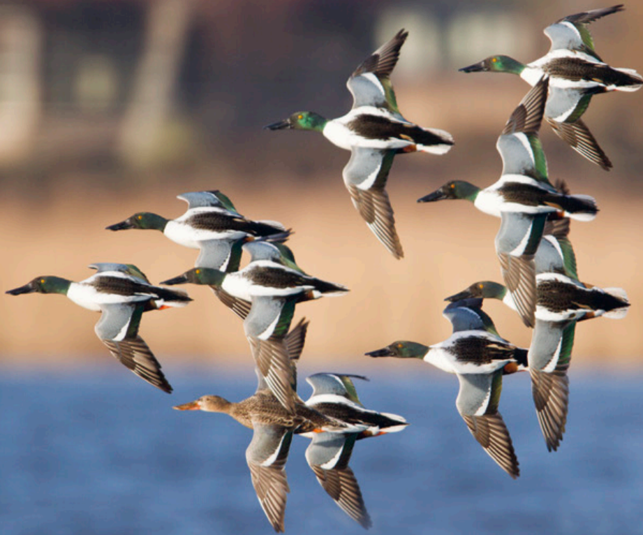
Slobeenden boven de Starvaartplas bij Leidschendam