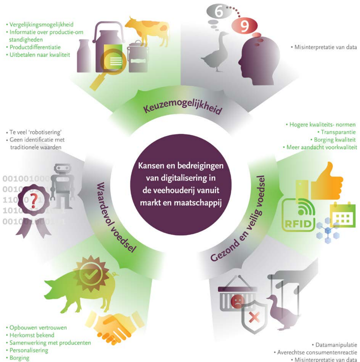
Figuur 3. Kansen en bedreigingen van digitalisering in de veehouderij vanuit markt en maatschappij.

Datamanipulatie vormt een bedreiging voor de gezondheid en veiligheid van ons voedsel. Het bewust zodanig doorgeven of beschikbaar stellen van data opdat een onjuist beeld wordt gegeven van de productieomstandigheden en/of de productkwaliteit en -samenstelling kan op vele manieren. Bijvoorbeeld door het benadrukken van goede aspecten van welzijn maar weglaten van negatieve aspecten op milieu. Waar in de stal hangen de sensoren die het klimaat meten, wat gebeurt er met een RFID-tag als een dier deze verliest, et cetera?