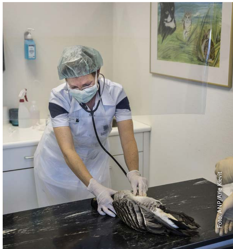
Hulp aan dieren vereist noodzakelijke deskundigheid, ook vanwege de eigen veiligheid