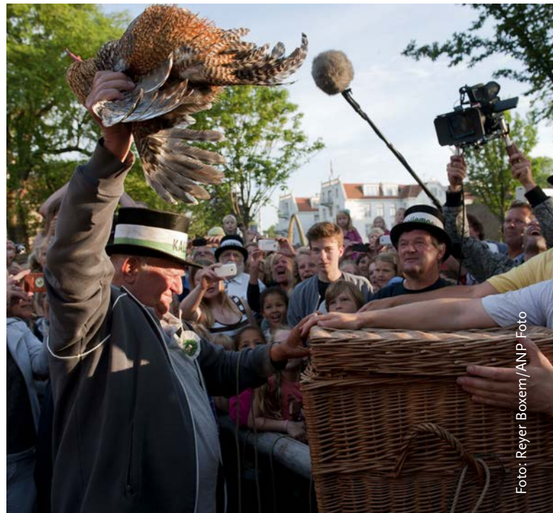
Lokale tradities met dieren, zoals Kallemeo op Schiermonnikoog, roepen discussie op.

Voor deze zienswijze heeft de RDA bureauonderzoek gedaan en betrokkenen uit verschillende bestuurslagen geïnterviewd. De RDA blijft dicht bij de door de gemeenten genoemde onderwerpen die ook in het verzoek van de minister naar voren komen. Landbouwhuisdieren en veehouderij bleken hier beperkt onderdeel van te zijn.