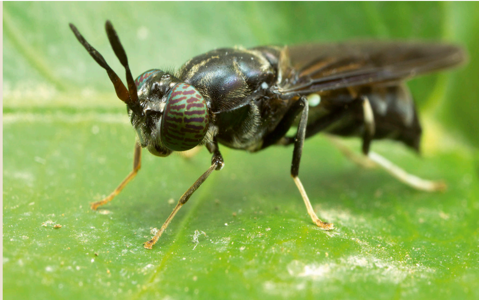
Voor het gebruik van de larven van de Black Soldier Fly om het composteringsproces van organisch materiaal te versnellen is al eens ontheffing verleend

Werkklank: Mede op basis van deze zienswijze heeft de Rijksdienst voor Ondernemend Nederland (RVO) de procedure voor het aanvragen van een ontheffing van de productiedierenlijst aangepast. De staatssecretaris van EZ denkt nog na over een herbeoordeling van de huidige lijst, die alle dieren vermeldt die in Nederland voor productie mogen worden gehouden.