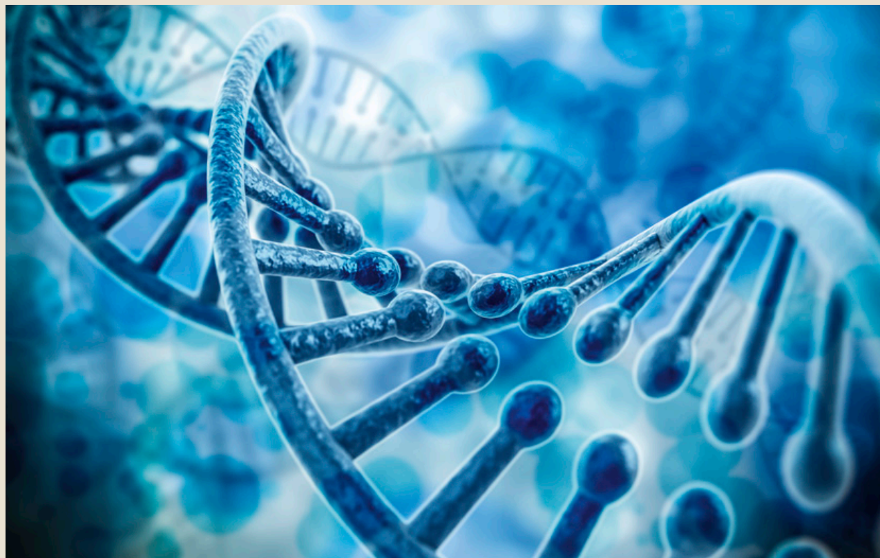
Model van DNA-string